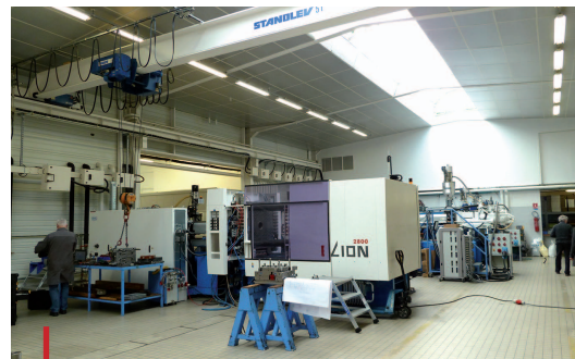
Le centre d'essais et de mises au point des outillages à Marcillé-la-Ville.

injection et injection-compression. En 2017, sa dernière année au sein du groupe Inglass, Ermo a réalisé un c.a. de 14 millions d'euros, dont 70 % à l'export, avec 120 salariés répartis sur les 3 sites de Marcillé-la-Ville, Mayenne et Vire. Outre les 20 % de c.a. issus de la maintenance d'outillages déjà livrés et de la fourniture de pièces de rechange, Ermo a produit en 2017 plus de 70 nouveaux moules, comptant plus de 700 empreintes, pour des applications cosmétiques (35 % du c.a.), pièces à paroi mince (30 %) et articles et dispositifs médicaux (20 %). Consacrant chaque année près de 10 % de son c.a. à la R&D, la société compte également recueillir les fruits de ses récentes avancées. Elle a ainsi mis en route plusieurs chantiers. L'un des plus importants concerne la motorisation élec-