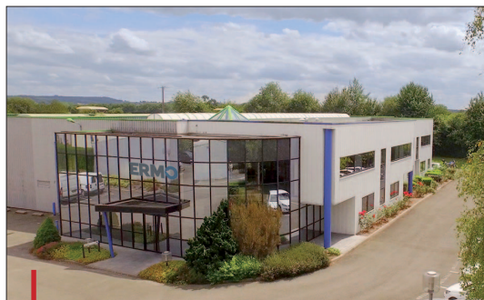
Le site de Marcillé-la-Ville (Mayenne), à l'origine du mouliste Ermo.

En termes d'activité, son objectif est de renouer avec les 20 millions d'euros de c.a. dans les 3 prochaines années en spécialisant l'unité de Vire (Calvados) sur les moules multi-empreintes (jusqu'à 96 empreintes) pour bouchons mono-, bi et même tri-matière et le site de Marcillé-la-Ville sur les moules à paroi mince pour barquettes et capsules en