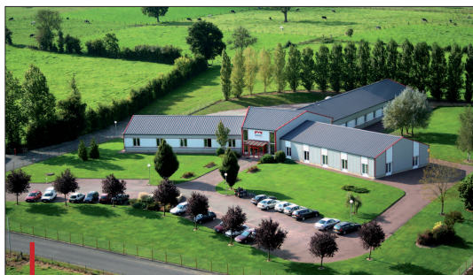
L'unité de Vire (Calvados) se consacrera bientôt uniquement à la production de moules pour le bouchage.

Bref, un programme à la mesure des ambitions élevées des nouveaux dirigeants.